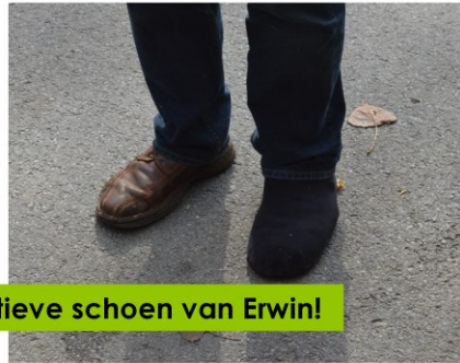
... de alternatieve schoen van Erwin!

De werkgroep schaalvergroting bestaat uit een afvaardiging vanuit 4 scholengemeenschappen basisonderwijs waarmee wij in de nabije toekomst willen samenwerken om de bestuurlijke optimalisatie en schaalvergroting te realiseren.