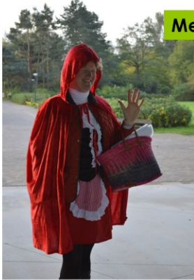
Met Roodkapje en ...